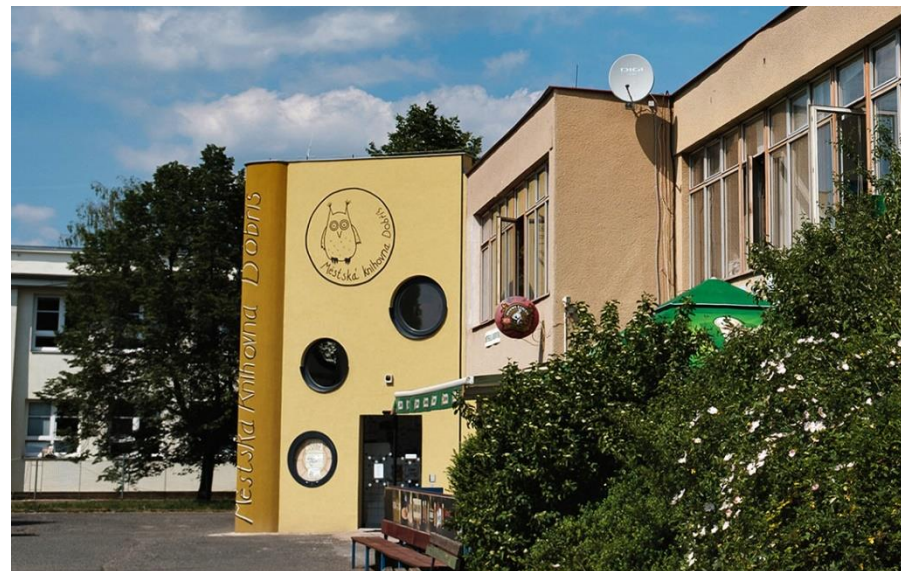
Dobříš – vstup do knihovny, 2014