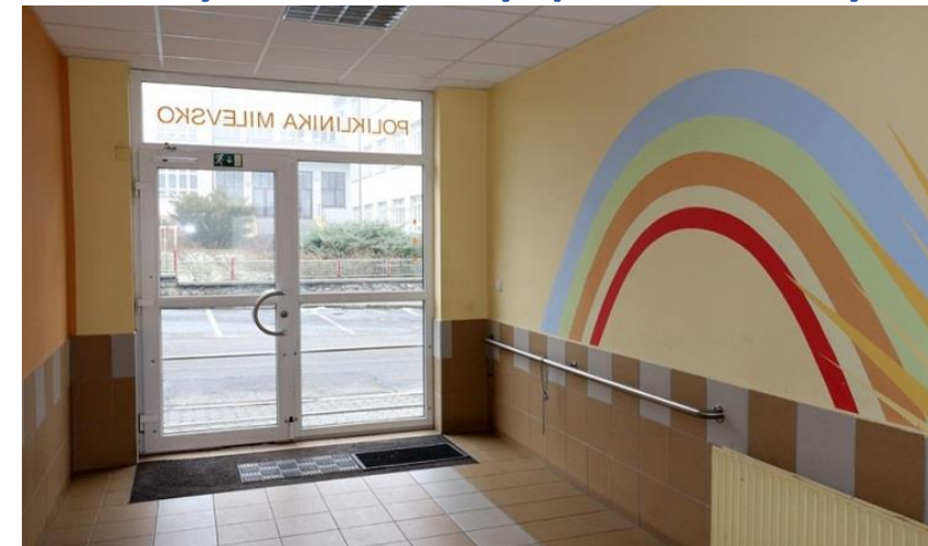
Milevsko - Poliklinika, bezbariérový přístup, 2016