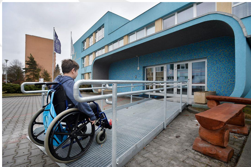
Plzeň – Gymnázium Františka Křižíka, 2017